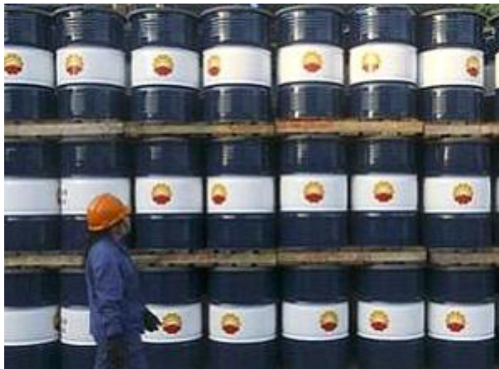
País importou mais de 11 milhões de barris por dia, segundo maior nível já registrado

Mas a preocupação com os níveis de importação também pode estar relacionada com o crescimento de 2% no consumo de petróleo nos Estados Unidos na última semana, totalizando 19,8 milhões de bar-