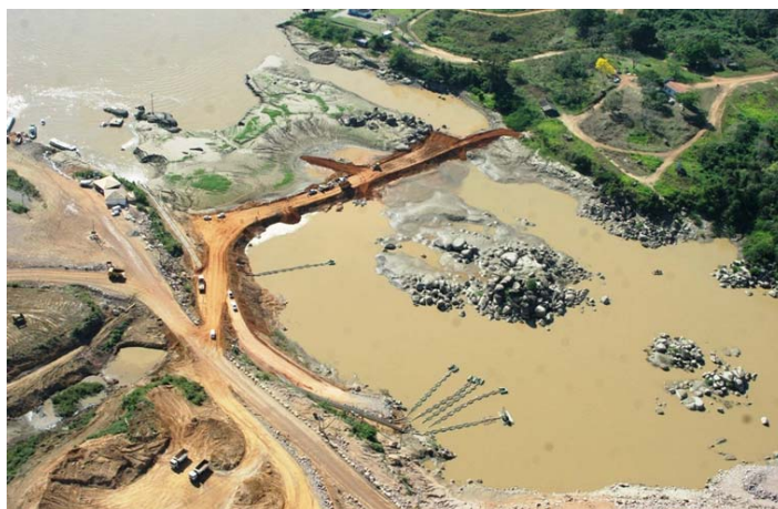
Obras de construção da hidrelétrica de Santo Antônio, no Rio Madeira (RO)

A Aneel autorizou a assinatura de um novo termo aditivo ao contrato de concessão sob a condição de o consórcio garantir uma conexão provisória para escoar a energia. A concessionária Santo Antônio Energia já solicitou à Aneel essa conexão provisória para 1º de setembro de 2011, quando começará a operação em teste que irá até 26 de fevereiro de 2012.