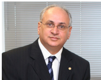
Gama: avaliação de projetos viáveis

Outro empreendimento previsto para 2011 é a usina de Inambari, no Peru, que terá ca-