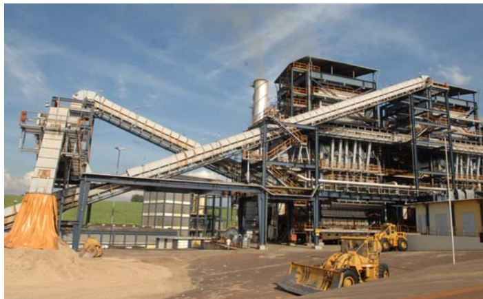
Usina Santa Adélia (SP) movida a biomassa gera, atualmente, cerca de 240 MWh

Um total de 55 projetos de biomassa estão cadastrados para o leilão de reserva, somando potência instalada de 3.518 MW, sendo que a maior parte das usinas inscritas são retrofits , que exigem maior investimento.